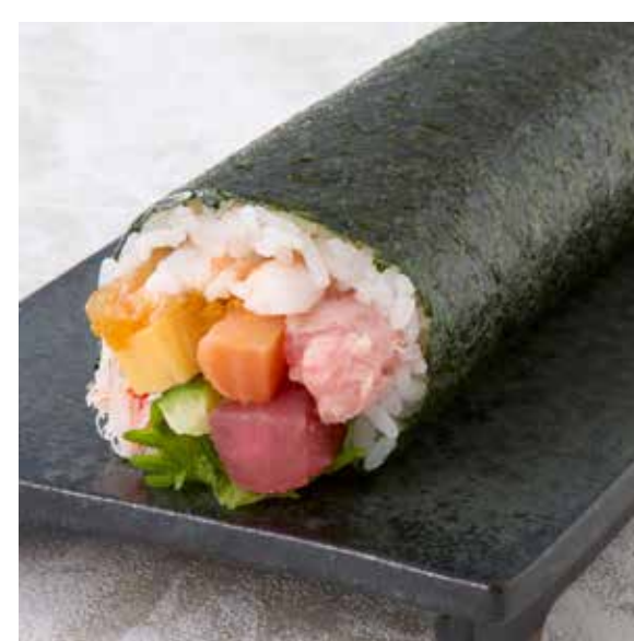
節分 7 種の海鮮太巻 1,836 円