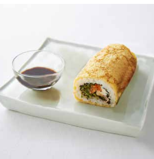
野菜と愉しむ 海老とアボカドの 福恵方巻き (ハーフ) 880 円