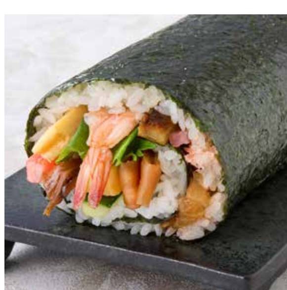
節分うず潮巻 1,598 円