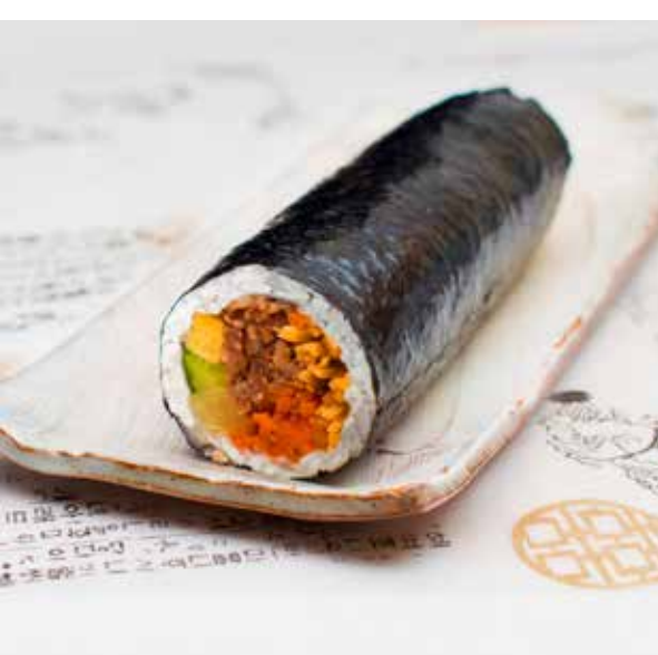
和牛プルコギキンパ 1,188 円