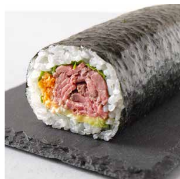
ローストビーフ巻 ～味わい葡萄牛～ (ハーフ) 960 円