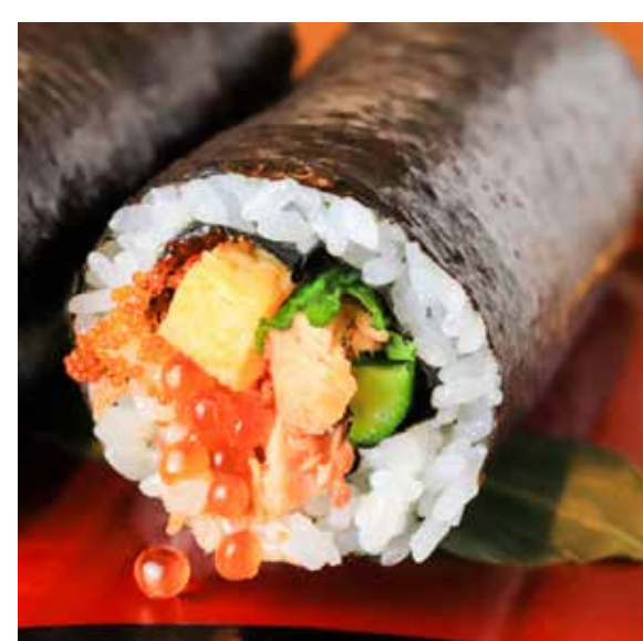
焼きハラスといくら恵方巻 1,404 円