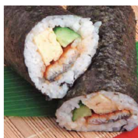
ミツ星弁当 頂の国産うなぎの恵方巻 1 本 1,490 円 / ハーフ 790 円