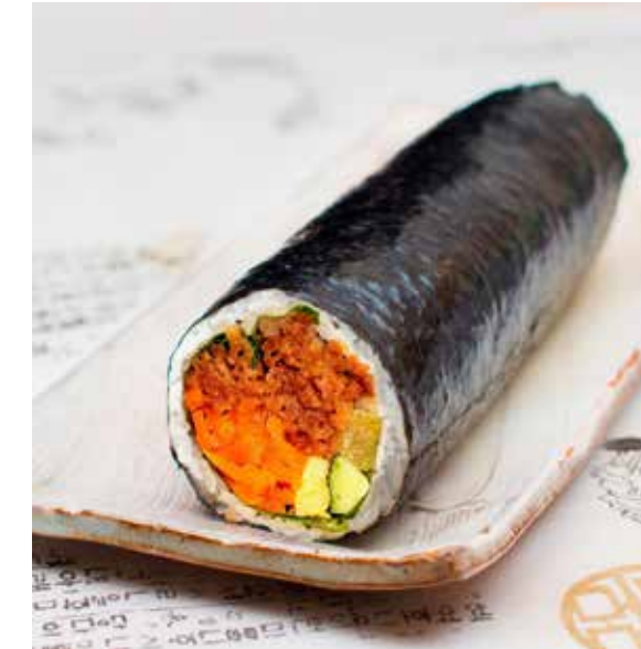
プルコギキンパ 951 円