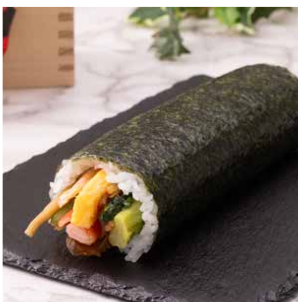
10 種具材使用！開運恵方巻 1,490 円