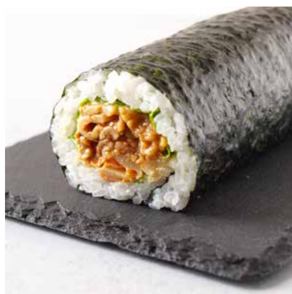
旨だれ牛焼肉巻 (ハーフ) 860 円