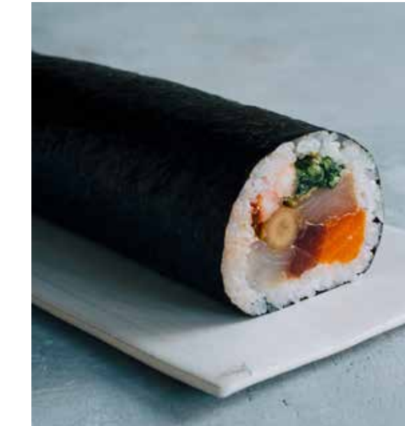
まぐろと鰯の海宝巻 1 本 3,780 円 / ハーフ 1,944 円