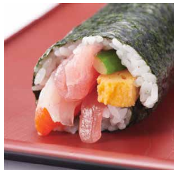
海鮮太巻 (エビ入り) 1,890 円