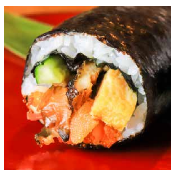
穴子と松前漬け恵方巻 1,404 円