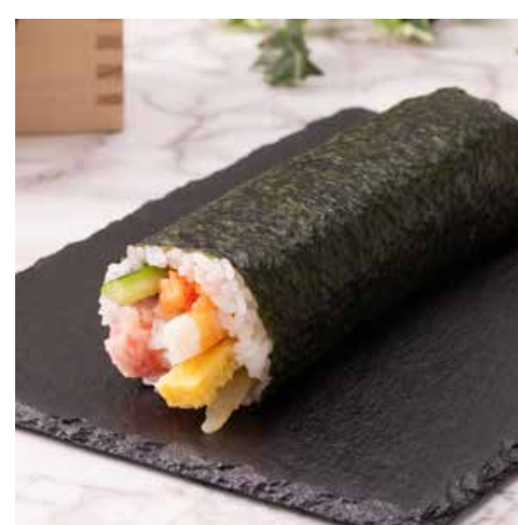
6 種魚介使用！海鮮恵方巻 1,790 円